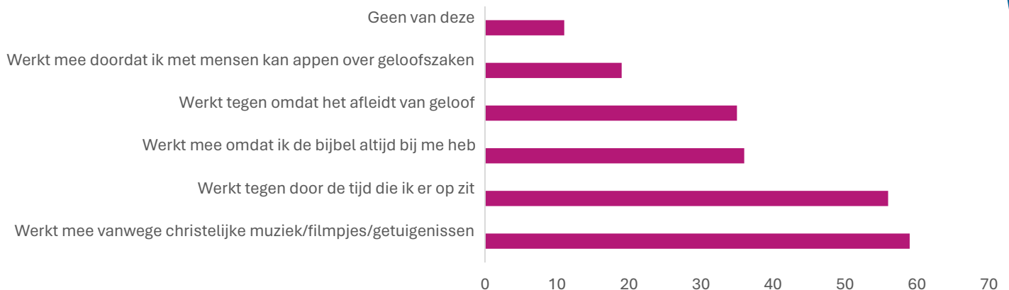
Grafiek 3: Op welke manier werkt je mobiel mee en tegen bij geloven (in %, kies maximaal drie dingen, in %, N= 999)

Een van de gevolgen van het intense telefoongebruik is het 'brokkelbrein' 8 . Een 'brokkelbrein' is niet meer in staat om langdurig ononderbroken aandacht te besteden aan één taak of zaak. Zelfs al willen jongeren graag iets bereiken of werken aan idealen, afleiding is een grote valkuil 9 . Jongeren worden (door hun ouders) steeds minder begrensd. Op het eerste gezicht lijken ze hier blij mee te zijn, maar jongeren worstelen met de ruimte die ze krijgen en zoeken naar houvast. Ze hebben kaders en zekerheden nodig. Schermgebruik en brokkelbrein zijn mede een oorzaak van het feit dat er veel onrust is in jeugdgroepen 10 . Het lijkt of een deel van de jongeren gedesoriënteerd is. Jeugdwerkers geven aan dat het