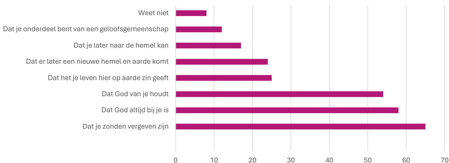
Grafiek 1: Op welke manier vind jij het Evangelie goed nieuws? (in %, kies maximaal drie dingen, N=999).

naar hoopvol nieuws. Het lijkt alsof we als kerk niet altijd meer weten wat het Evangelie kan betekenen voor jongeren. Veel mensen vinden het lastig om een boodschap te brengen die ook echt raakt aan hun leven. De kloof tussen de jongerencultuur en de kerkcultuur is groot.